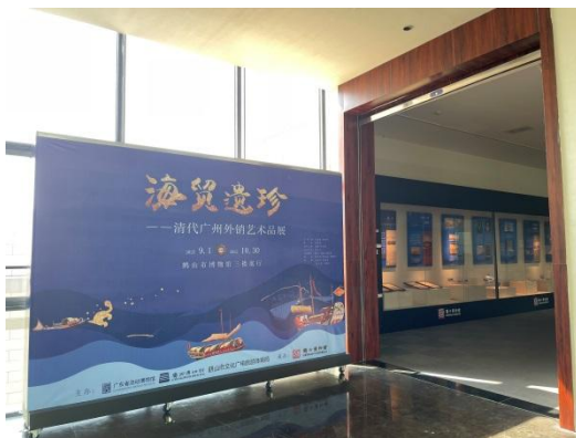
海贸遗珍——清代外销艺术